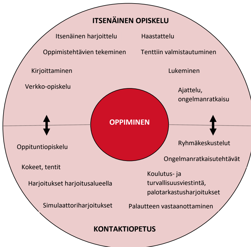
Kuva 2 Opiskelu pelastusalan päällystötutkinnoissa

Opiskelijan on kirjoitettava opinnäytetyönsä alalta kypsyysnäyte, joka osoittaa perehtyneisyyttä alaan ja suomen tai ruotsin kielen taitoa. Kypsyysnäyte kirjoitetaan opiskelijan koulusivistyskielillä. Jos opiskelijan koulusivistyskieli on muu kuin suomi tai ruotsi, kypsyysnäyte kirjoitetaan tutkintokielellä.