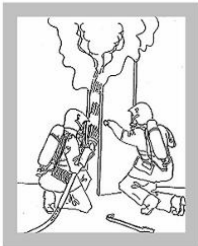
Jäähdytys ja sisään