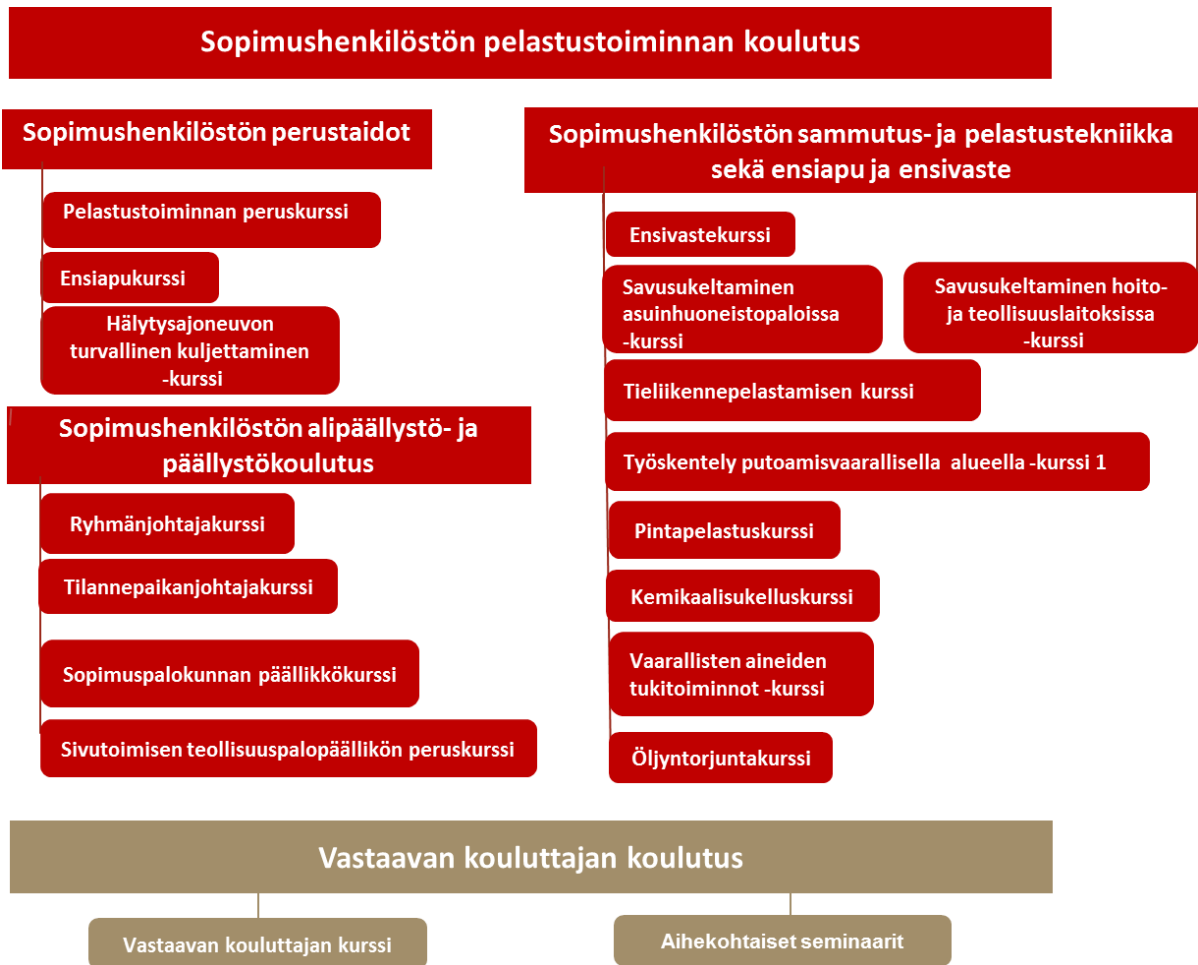
Kuva 1. Pelastusopiston sopimushenkilöstön koulutusjärjestelmä