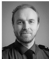
Johannes Ketola Ins. AMK Toimenpide- rekisteri, Tilastopalvelut