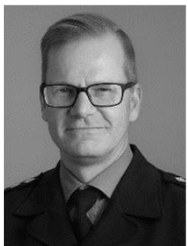
Esa Kokki FT Tilastot, Pronto, Rekisteritutkimus