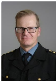
Esa Kokki FT Tilastot, Pronto, Rekisteritutkimus