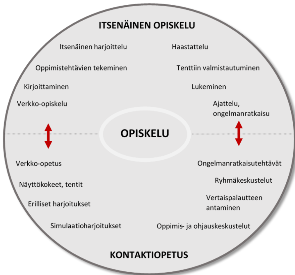
Kuva 2 Opiskelumenetelmät hätäkeskuspäivystäjän koulutusohjelmassa

Opiskelu on ongelmakeskeistä ja tähtää sisällöllisten tavoitteiden ohella tiedollisten taitojen oppimiseen: esimerkiksi tiedonhankinnan, tiedon arvioinnin, päätöksenteon ja ajattelun valmiuksien kehittämiseen. Opiskelija on oppimisprosessissa vastuullinen toimija.