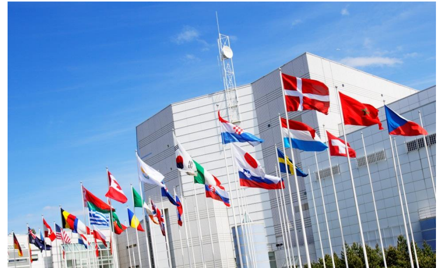
12 th Conference on Injury Prevention and Safety Promotion, Safety 2016 -konferenssi