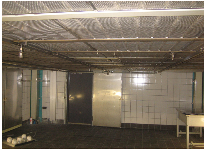
Kuva 3. Pelastusopiston paloteatteritila

Ensimmäinen koe järjestettiin ennen palovaroitinlaitteistojen asennusta Hyvinkään sikatalouteen, kesäkuussa 2006. Silloin kaikki laitteet kävivät läpi saman testisarjan. Tällä ns. alkutestillä, puhtailla laitteilla, vertaillaan mahdollisia eroja laitteiden kesken reagointinopeudessa. Koeajan päätyttyä suoritetaan sama testisarja uudelleen kaikille laitteistoille, tämä ajoittuu toukokuulle 2007. Näiden ns. lopputestien tulokset viitoittavat sen, onko laitteistojen toimintakyky heikentynyt tai hidastunut seurantajakson aikana maatalaolosuhteiden vaikutuksen vuoksi.