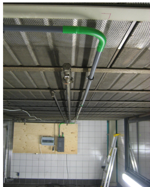
Kuvat 4 ja 5. Palovaroitinjärjestelmiä asennettuina paloteatterissa, Elotec ja Eltek.