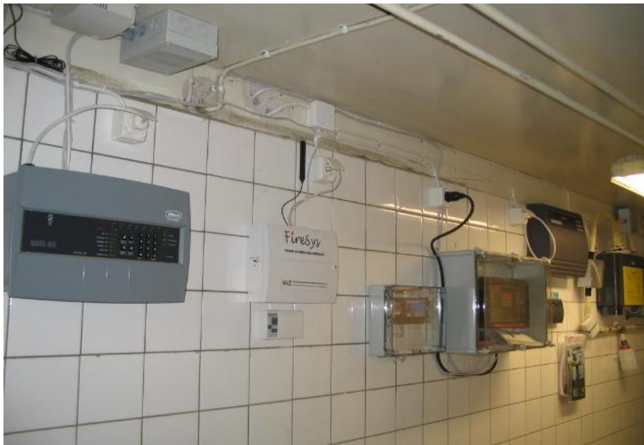
Kuva 2. Keskuksia huoltotilan käytävän seinällä.

Seurantajakson tärkein tehtävä on, yhdessä polttokokeiden kanssa, tuottaa tietoa palovaroitinlaitteistojen hyväksymisperiaatteille sekä tulevaisuudessa luotavien teknisten asennusohjeiden pohjaksi.